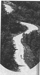
La difficile ascension du col de Bruis

Extrait de l'article paru dans la revue Alpes loisir (été 2003)